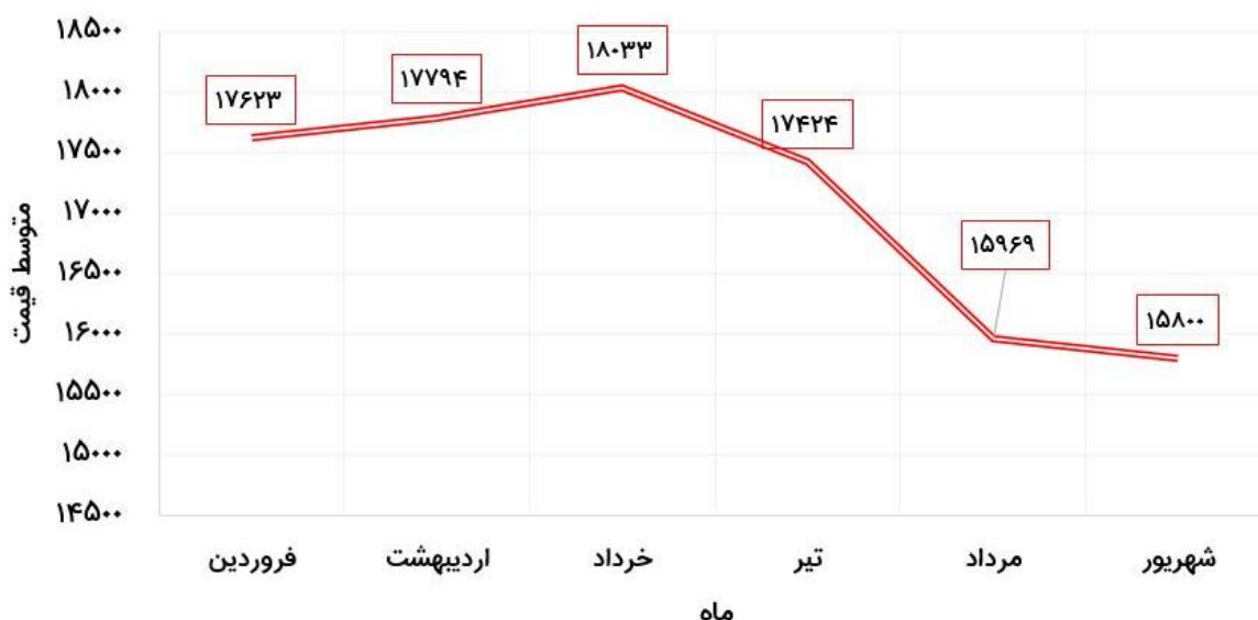
نمودار نوسانات قیمت میلگرد اصفهان در سال 1401

قیمت این میلگرد نیز همانند تمامی میلگردهای بازار، در اوایل سال به دلیل اوج‌گیری جنگ روسیه و اوکراین و انتشار خبر قطعی برق کارخانه‌های فولادی، به تدریج بالا رفت، اما با انتشار خبرهای مثبت در مورد احیای برج‌ام، به تدریج پایین آمد تا حدی که قیمت این میلگرد از قیمت آن در ابتدای سال هم کمتر شد.